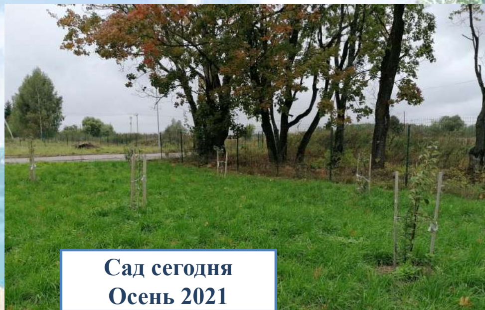
Сад сегодня Осень 2021