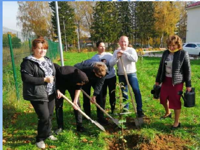
Посадка яблоневого сада Осень 2020