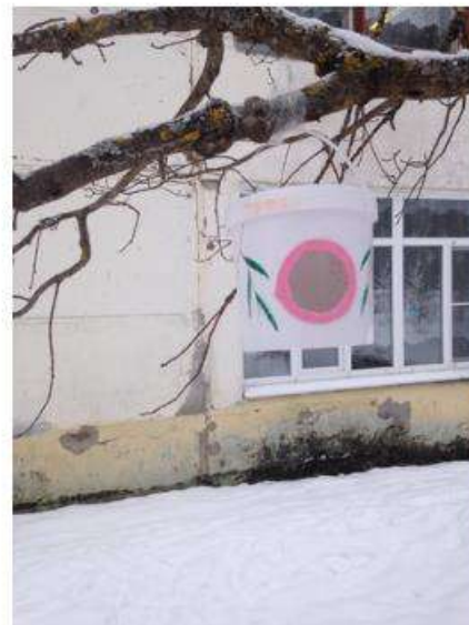
Фото добавляем в комментариях.

Ученики 5 класса приглашают присоединиться всех желающих.