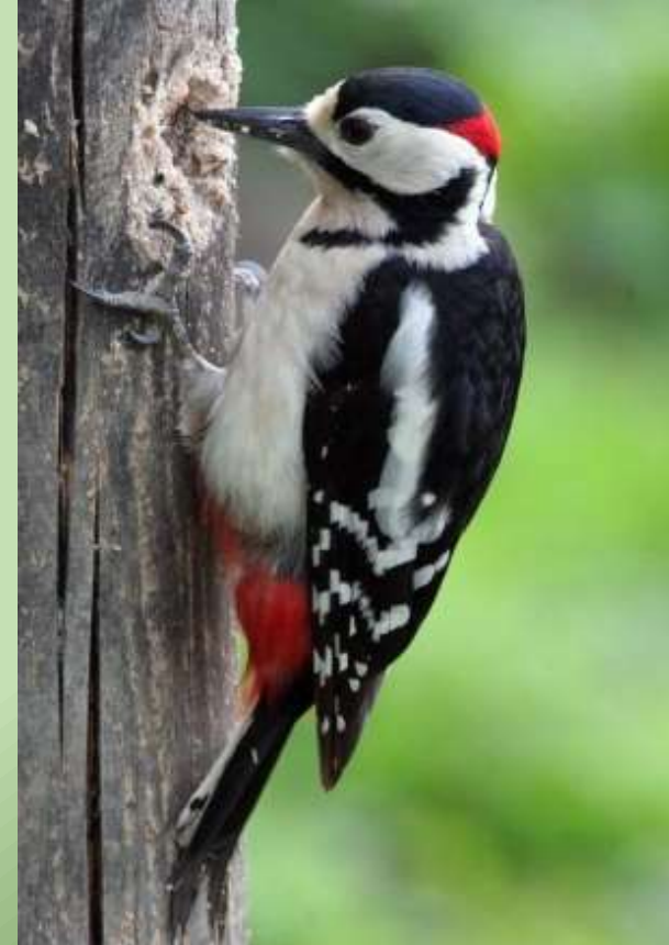
Большой пёстрый дятел