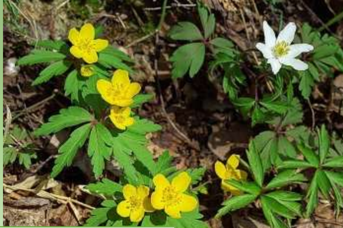
Ветреница лютичная (жёлтая) и дубравная (белая)