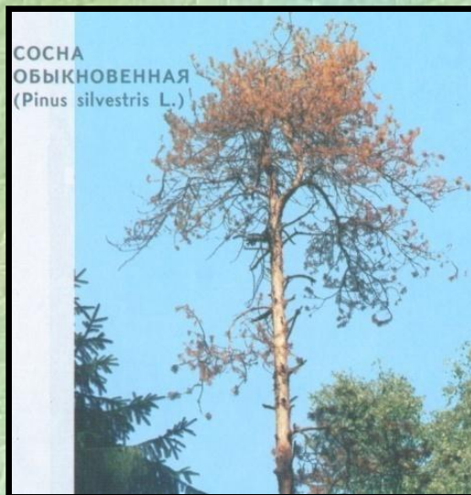
Сухостой текущего года