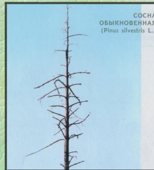
Сухостой прошлых лет